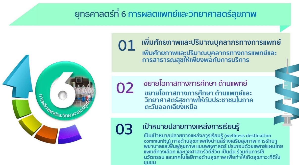
ภาพที่ 6 ยุทธศาสตร์ที่ 6 การผลิตแพทย์และวิทยาศาสตร์สุขภาพ

มหาวิทยาลัยราชภัฏร้อยเอ็ด ตระหนักและเล็งเห็นถึงคุณภาพชีวิตและสุขภาพอนามัยของประชากรในปัจจุบัน จึงจำเป็นต้องผลิตบุคลากรทางการสาธารณสุขเพิ่มมากขึ้น เพื่อให้สามารถกระจายไปสู่ระดับท้องถิ่น ชุมชนได้สัดส่วนที่เหมาะสมและสอดคล้องกับแผนพัฒนาเศรษฐกิจและสังคมแห่งชาติ ฉบับที่ 13 พ.ศ. 2566 - 2570 ภายใต้วิสัยทัศน์ “มุ่งพัฒนาผู้เรียนให้มีความรู้คู่คุณธรรม มีคุณภาพชีวิตที่ดี มีความสุขในสังคม”