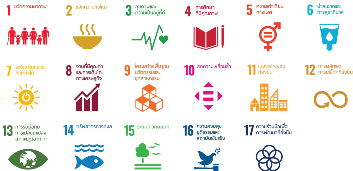
ภาพที่ 10 เป้าหมายการพัฒนาที่ยั่งยืน (Sustainable Development Goals – SDGs)