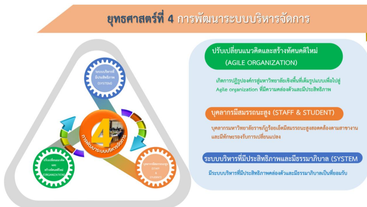
ภาพที่ 4 ยุทธศาสตร์ที่ 4 การพัฒนาระบบบริหารจัดการและความสอดคล้องเป้าประสงค์

มหาวิทยาลัยราชภัฏร้อยเอ็ด มุ่งเน้นและให้ความสำคัญหลักการบริหารจัดการองค์กรที่ดีใช้หลักธรรมาภิบาลควบคู่กับ เน็กซ์ โมเดล (NEXTS Model) ปรับปรุงและพัฒนาองค์กรสู่ดิจิทัลและมหาวิทยาลัยสีเขียว (Digital organization & Green university) และพัฒนาบุคลากรให้เป็นผู้ดำเนินการเปลี่ยนแปลงมีการปรับเปลี่ยนแนวคิดและสร้างทัศนคติใหม่ (Agile learner) พร้อมทำงานเชิงรุก รวมทั้งจัดทำระบบสวัสดิการเพื่อสนับสนุนกิจการของมหาวิทยาลัย เน้นการสร้างเครือข่ายเพื่อการพัฒนาทางด้านต่าง ๆ เป็นสถาบันการศึกษาเพื่อการพัฒนาท้องถิ่น พัฒนาศูนย์ข้อมูลและระบบสารสนเทศที่มีประสิทธิภาพและทันสมัย ส่งเสริม สนับสนุนนักศึกษาและบุคลากรให้เข้าถึงระบบข้อมูลและสารสนเทศอย่างครอบคลุมทุกพื้นที่และอย่างมีประสิทธิภาพ