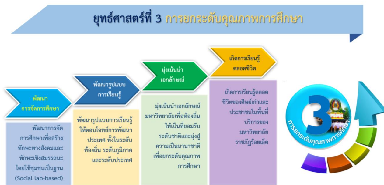
ภาพที่ 3 ยุทธศาสตร์ที่ 3 การยกระดับคุณภาพการศึกษาและความสอดคล้องของเป้าประสงค์

ปรับปรุงหลักสูตรเดิมให้ทันสมัยและพัฒนาหลักสูตรใหม่ในรูปแบบสหวิทยาการที่ตอบสนองต่อการพัฒนาท้องถิ่นและสอดคล้องกับแนวทางการพัฒนาประเทศ ส่งเสริมการเรียนรู้ของนักศึกษาให้มีทักษะชีวิต ทักษะวิชาชีพและทักษะวิชาการและพัฒนาระดับความสามารถทางภาษาของนักศึกษา โดยใช้กระบวนการ “วิศวกรสังคม” เป็นกลไกการพัฒนาทักษะเชิงสมรรถนะ(Soft Skills) คุณลักษณะ 4 ประการ ตามพระราชโอบาย เพื่อเป็นผู้นำการเปลี่ยนแปลงและพัฒนาชุมชนท้องถิ่น มุ่งเน้นความเป็นเลิศทางการศึกษา หลักสูตรสมรรถนะ การบูรณาการองค์ความรู้จากท้องถิ่นสู่มาตรฐานสากลและยกระดับการจัดการศึกษา งานวิจัยร่วมกับภาคีเครือข่ายทั้งระดับชาติและนานาชาติ รวมทั้ง การนำเทคโนโลยีมาใช้ในการจัดการศึกษา