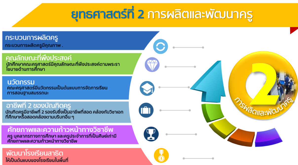
ภาพที่ 2 ยุทธศาสตร์ที่ 2 การผลิตและพัฒนาครู และความสอดคล้องของเป้าประสงค์

มหาวิทยาลัยราชภัฏร้อยเอ็ด มุ่งบูรณาการการผลิตบัณฑิตครูศาสตร์แบบสหวิทยาการและเสริมสร้างสมรรถนะและทักษะ เพื่อการพัฒนากระบวนการผลิตครูให้มีความสมดุลทั้งคุณภาพและคุณธรรม เพื่อเป็นต้นแบบครูเพื่อศิษย์ ตลอดจนพัฒนานวัตกรรมการศึกษาตบโจทยการศึกษาของโลกอนาคตร่วมกับภาคีเครือข่ายที่เกี่ยวข้องเพื่อนำไปสู่การเป็นนักพัฒนาและนวัตกรรมที่มีทัศนคติที่ดีมีอัตลักษณ์ และความโดดเด่นหลากหลาย สอดคล้องกับความต้องการบุคลากรครูของท้องถิ่นและประเทศ และมีมาตรฐานระดับสากล พร้อมยกระดับความก้าวหน้าทางวิชาชีพครูของบัณฑิตครูราชภัฏอย่างต่อเนื่อง เพื่อความมั่นคงทางเศรษฐกิจและสังคม ตามหลักปรัชญาเศรษฐกิจพอเพียง