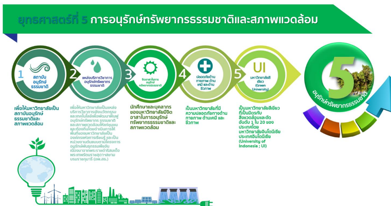
ภาพที่ 5 ยุทธศาสตร์ที่ 5 การอนุรักษ์ทรัพยากรธรรมชาติและสภาพแวดล้อม

มหาวิทยาลัยราชภัฏร้อยเอ็ด มุ่งเน้นการใช้ทรัพยากรธรรมชาติและสภาพแวดล้อมอย่างฉลาดโดยใช้ให้น้อย เพื่อให้เกิดประโยชน์สูงสุดโดยคำนึงถึงระยะเวลาในการใช้ให้ยาวนานและก่อให้เกิดผลเสียหายต่อสภาพแวดล้อมน้อยที่สุด รวมทั้งต้องมีการกระจายการใช้ทรัพยากรธรรมชาติอย่างทั่วถึง โดยทำการพัฒนาภูมิทัศน์และสภาพแวดล้อมให้ร่มรื่น น่าอยู่ น่าเรียนมีบรรยากาศทางวิชาการ สร้างความรัก ความสามัคคี สร้างสุขภาวะที่ดี เพื่อให้ให้นักศึกษาและบุคลากรทุกคนมีความสุข อบอุ่น และปลอดภัยและในปี 2566 ให้ได้รับรางวัลมหาวิทยาลัยสีเขียว (Green University) บริการวิชาการเพื่อพัฒนาฟื้นฟูและอนุรักษ์ทรัพยากรธรรมชาติและสภาพแวดล้อมให้แก่ชุมชน และท้องถิ่นโดยดำเนินการให้พื้นที่ของมหาวิทยาลัยเป็นองค์กรแห่งการเรียนรู้และเป็นหน่วยงานต้นแบบตามโครงการอนุรักษ์พันธุกรรมพืชอันเนื่องมาจากพระราชดำริสมเด็จพระเทพรัตนราชสุดาฯ สยามบรมราชกุมารี (อพ.สธ.)