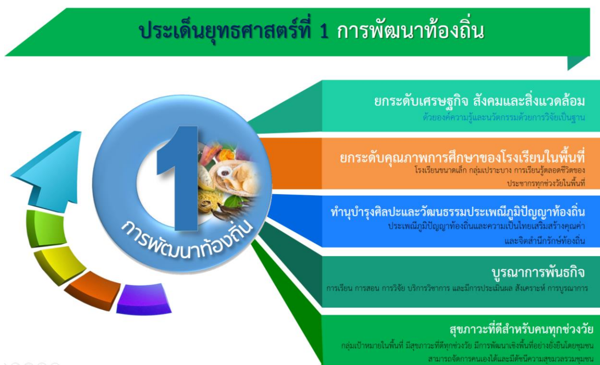
ภาพที่ 1 ยุทธศาสตร์ที่ 1 การพัฒนาท้องถิ่น และความสอดคล้องของเป้าประสงค์

มหาวิทยาลัยราชภัฏร้อยเอ็ด มุ่งการบูรณาการการบริการวิชาการกับการเรียนการสอน การวิจัยและการผลิตบัณฑิตที่เชื่อมโยงภูมิปัญญาในระดับท้องถิ่นระดับชาติและระดับสากล นำองค์ความรู้ที่มีความหลากหลายทางวิชาการไปพัฒนาชุมชนเสริมสร้างความเข้มแข็งของผู้นำชุมชนและท้องถิ่น โดยมีการประสานความร่วมมือและช่วยเหลือเกื้อกูลกันระหว่างมหาวิทยาลัย ชุมชน พัฒนาความรู้ด้านการประกอบอาชีพ เพื่อสร้างรายได้ให้กับชุมชนผ่านการพัฒนาศักยภาพด้านสินค้าและบริการ พัฒนาชุมชนให้เป็นแหล่งท่องเที่ยวเชิงวัฒนธรรม