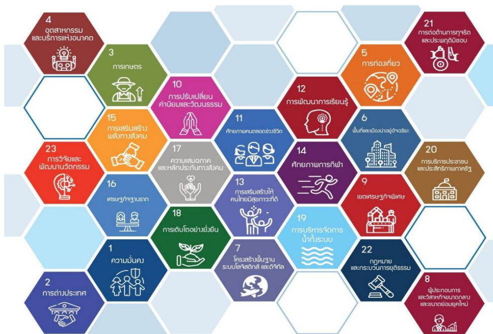
ภาพที่ 8 แผนแม่บท 23 ประเด็น

แผนแม่บทภายใต้ยุทธศาสตร์ชาติเป็นส่วนสำคัญในการถ่ายทอดเป้าหมายและประเด็นยุทธศาสตร์ ของยุทธศาสตร์ชาติลงสู่แผนระดับต่าง ๆ ต่อไป ซึ่งได้คำนึงถึงประเด็นร่วมหรือประเด็นตัดข้ามยุทธศาสตร์ และการประสานเชื่อมโยงเป้าหมายของแต่ละแผนแม่บทภายใต้ยุทธศาสตร์ชาติให้มีความสอดคล้องไปในทิศทางเดียวกัน แนวทางการพัฒนาและแผนงาน/โครงการที่สำคัญของแผนแม่บทภายใต้ยุทธศาสตร์ชาติ เพื่อเป็นกรอบในการดำเนินการของหน่วยงานที่เกี่ยวข้องให้บรรลุเป้าหมายการพัฒนาประเทศที่กำหนดไว้ แผนแม่บทภายใต้ยุทธศาสตร์ชาติ มีจำนวนรวม 23 ฉบับ