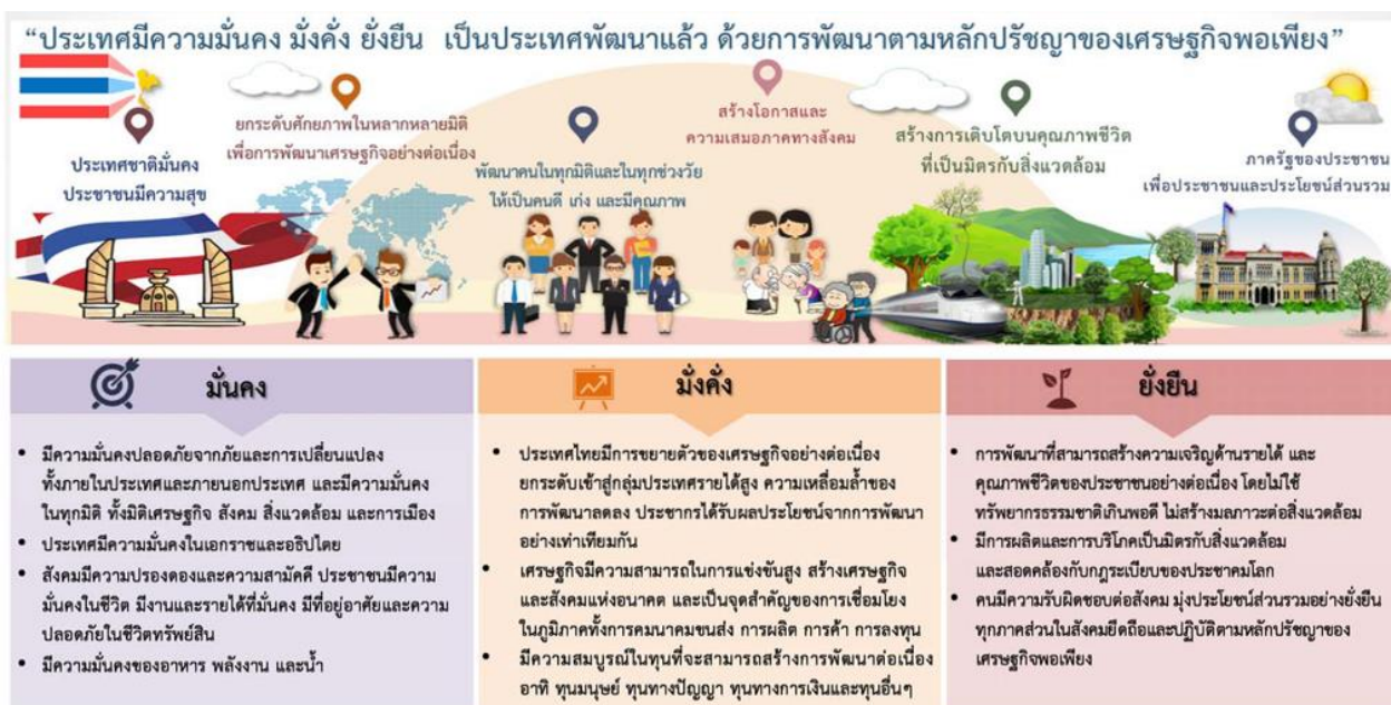
ภาพที่ 7 กรอบแผนยุทธศาสตร์ชาติ